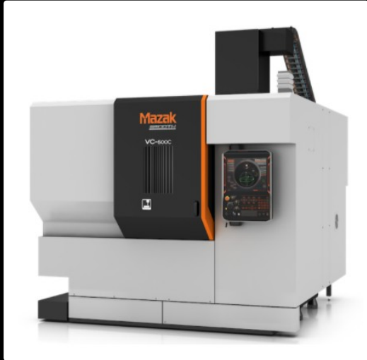
CENTRO DE MAQUINADO MAZAK VC500C , 2019