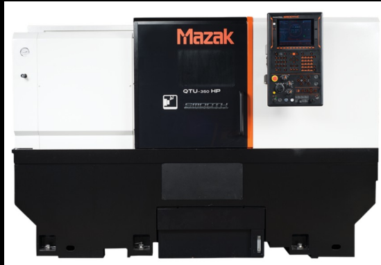
TORNO MAZAK QTEZ12 HORIZONTAL, 2023