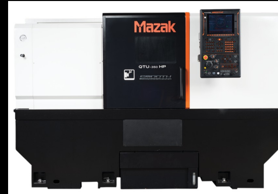
TORNO MAZAK QTEZ10 HORIZONTAL, 2023