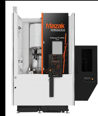
TORNO MAZAK MEGATURN 500 VERTICAL, 2020

VOLTEO:26" MAQUINADO: 19.6 " PESO MAX DE PZA: 500 KG LARGO:20.2" CHUCK: 18" CON GRUA Y POLIPASTO DEDICADO DE HASTA 2 TON