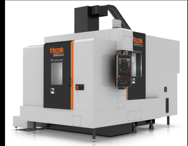
CENTRO DE MAQUINADO MAZAK VCEZ20, 2021