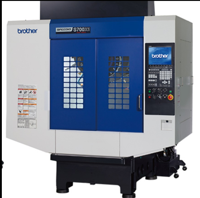
CENTRO DE MAQUINADO BROTHER S700Xd1, 2020