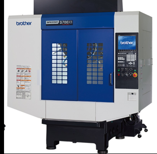
CENTRO DE MAQUINADO BROTHER S700Z1, 2023