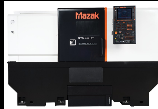
TORNO MAZAK QTU 350 HORIZONTAL, 2019