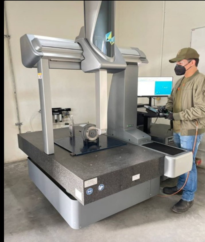
CNC HEXAGON GLOBAL S GREEN 7.10.7 , 2022 710 mm x 1010 mm x 780 mm