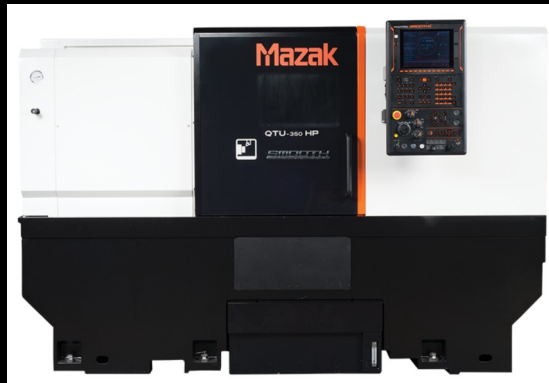
TORNO MAZAK QTU 350 HORIZONTAL, 2019